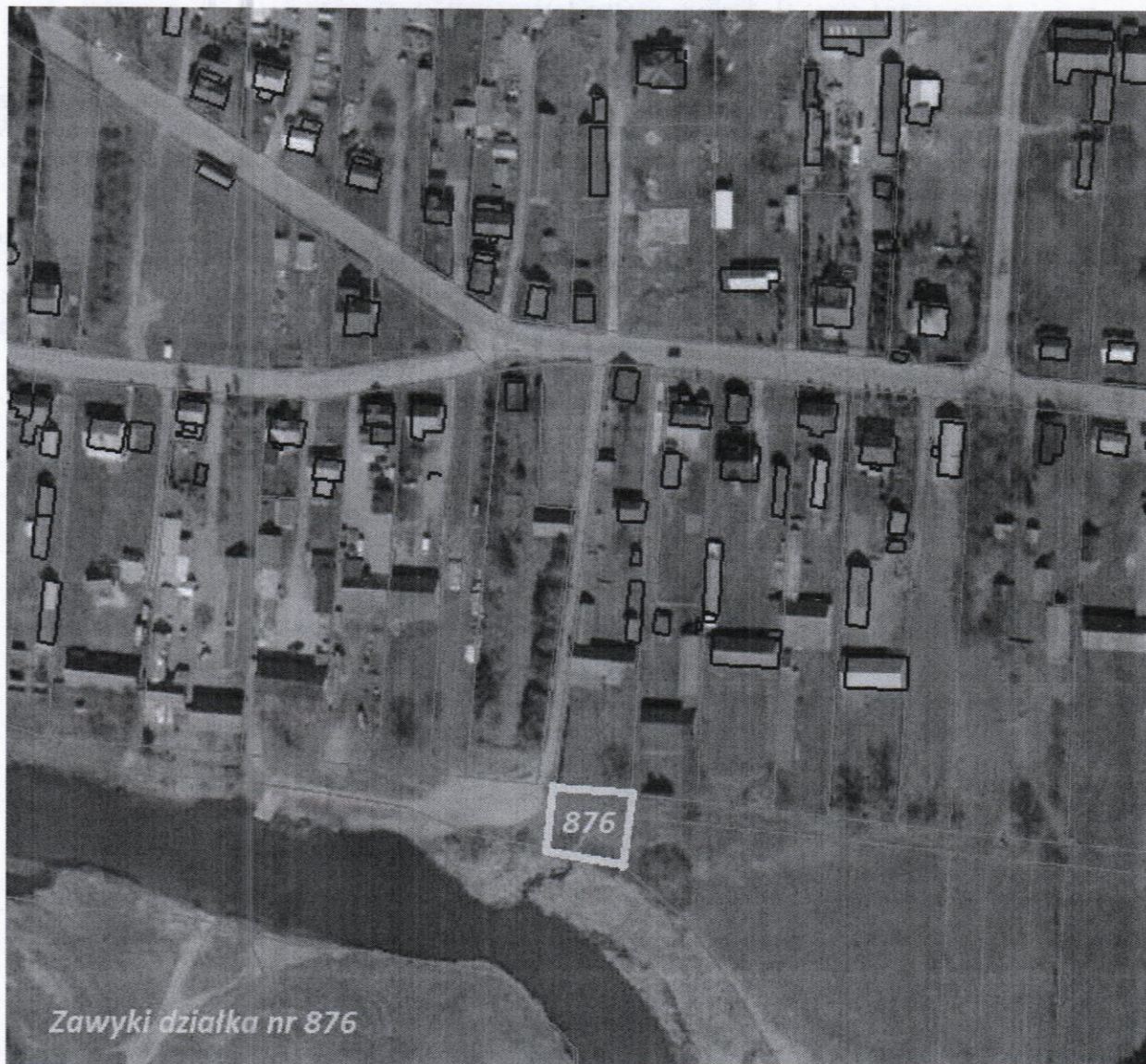
Zawyki działka nr 876